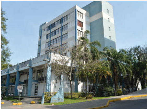
Centro Administrativo Municipal