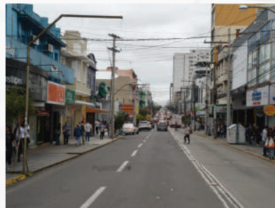
Rua do Acampamento