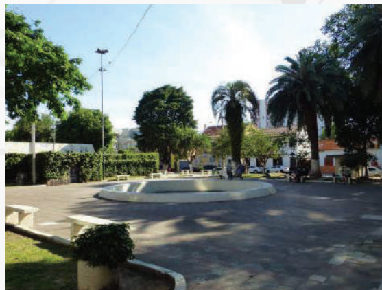
Praça Saturnino de Brito