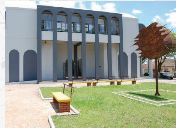
Biblioteca Pública Municipal