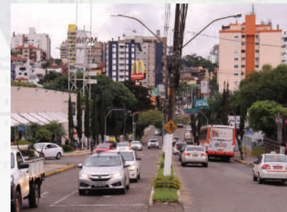
Av. Fernando Ferrari