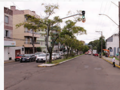
Av. Presidente Vargas