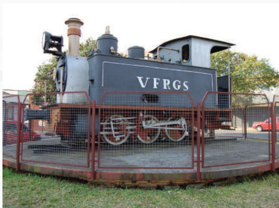
Largo da Locomotiva