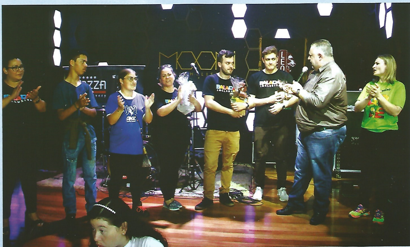
O presidente participou da 4ª Edição da Balada Inclusiva, que promove interação e inclusão social de pessoas com deficiência. A Câmara conta com a Frente Parlamentar em Defesa da Pessoa com Deficiência e trabalha ativamente todos os anos a Semana da Pessoa com Deficiência.